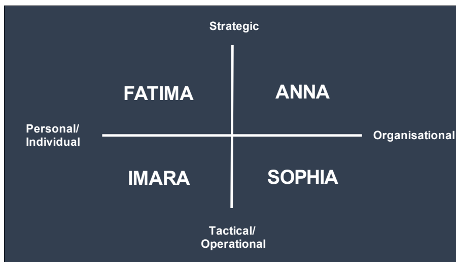
Cijfer 1: Balanced scorecard met vier cases.